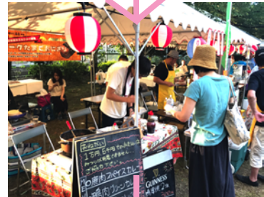
お店も賑わっています