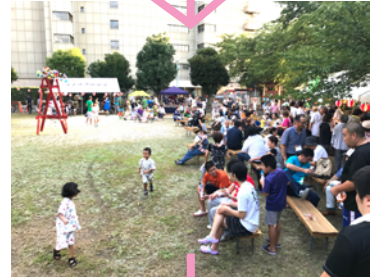
ステージ開演前 少しくつ 人が集まっています