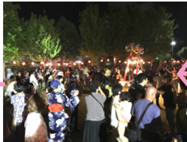
夜もふけてきて お客さんがどんどん 増えていきました