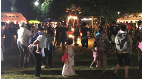
盆踊りの時はやぐらを囲んで 老いも若きも皆さん一緒に 踊っておられました