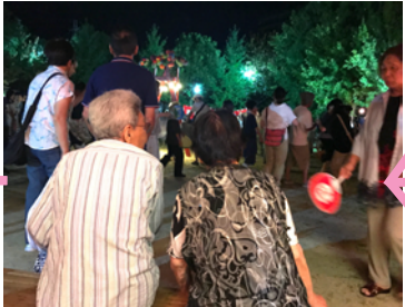
地元の方はゆっくり 昔話でしょうか?