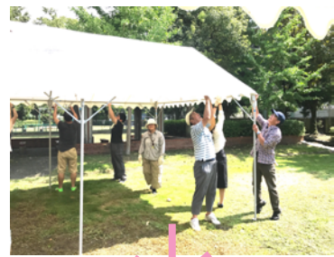
お祭り前日 地元の方と 設営準備です