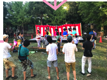
ステージも お客さんも一緒に 盛り上がります