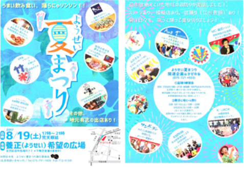
実行委員会作成チラシ 表・裏