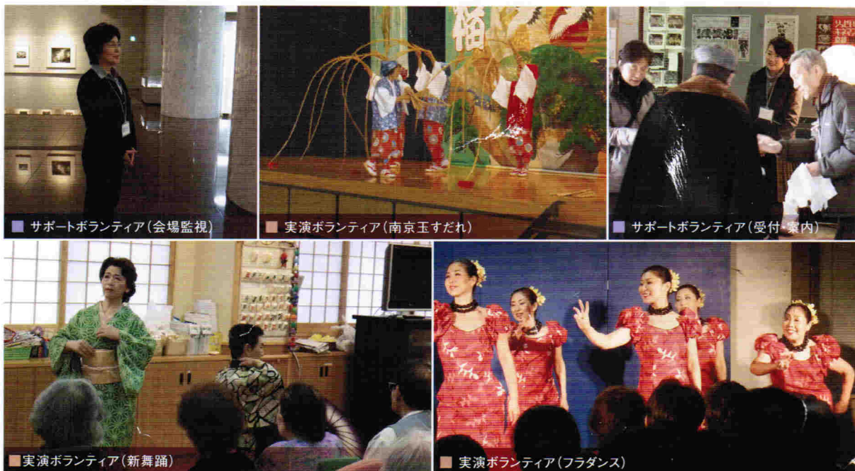
■ サポートボランティア(会場監視)